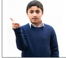
Faites « non » avec votre doigt (Mā lā - ne ... pas)