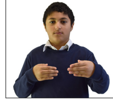
Montrez une action avec vos mains (Taf'aloūn - faites)