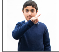
Faites « non » avec votre doigt (Mā lā - ne ... pas)