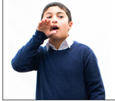
Mettez une main à côté de votre bouche et faites semblant de parler (Taqūlōūna – dites-vous ce que vous)