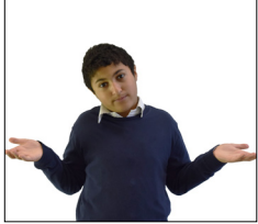
Haussez les épaules (Lima - pourquoi)