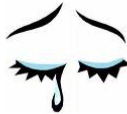
Pleurer pour les choses de la vie