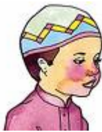
Faire le niyyat