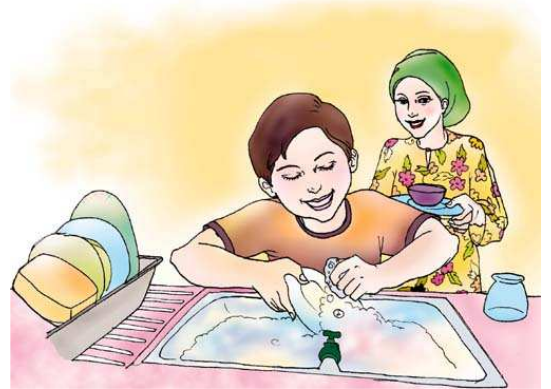
Faire la vaisselle