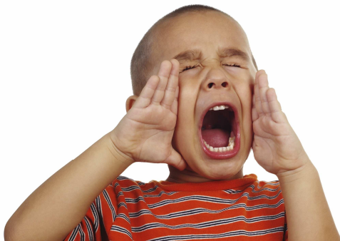
Crier quand on a faim