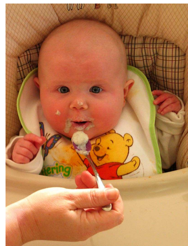
Faire manger notre petit frère ou petite soeur