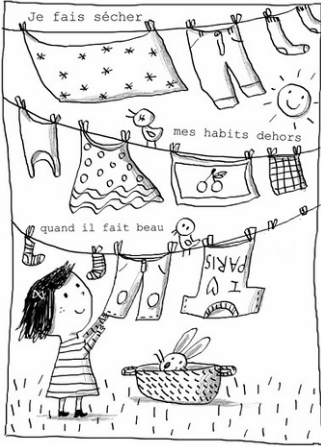
Sécher le linge