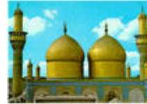
KAZMAYNE / BAGHDAD