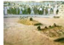
JANNATOUL BAKI, MADINA