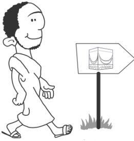
Aller au hajj une fois dans sa vie si nous avons les moyens