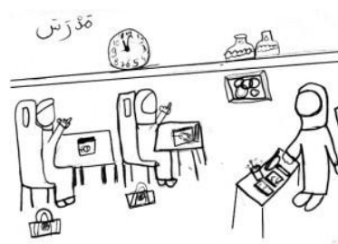
Aller au Madressa