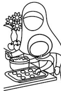
Aider sa maman