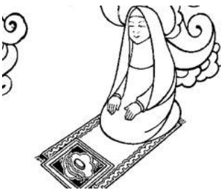
Faire le namaz